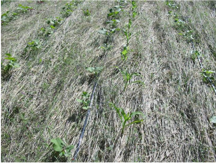
Transplants sur paillis (23 août) (4 photos)