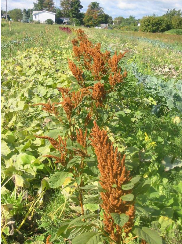
Transplants sur paillis le 12 septembre (4 photos)