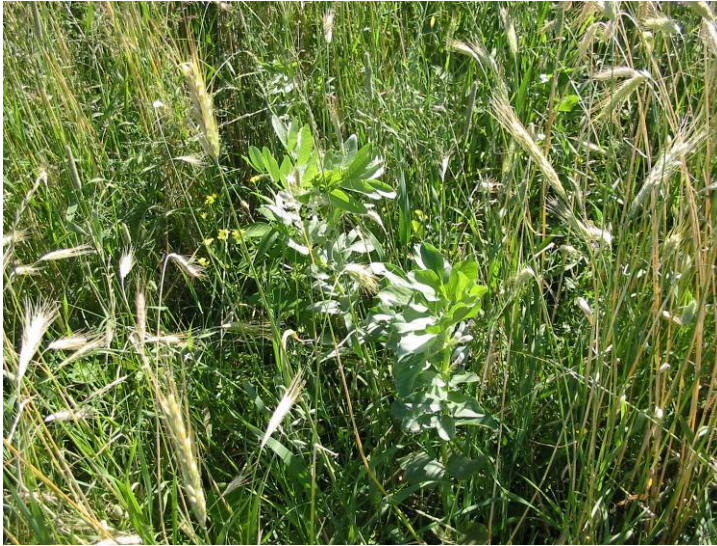
Seigle d'automne et pois (2 photos) (13 juillet)