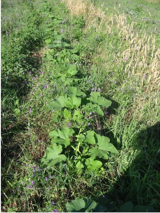
Transplants (23 août)